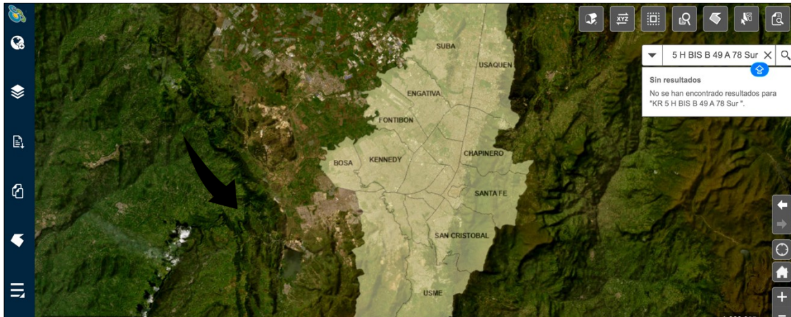
Imagen No. 1. Fecha de captura: 06-05-2026.

En tal sentido, se le solicita entregar información técnica específica que permita localizar con precisión el predio o Bien de Uso Público objeto de la actuación. De ser posible, complementando la información con indicadores catastrales (código catastral, CHIP), o el código del Folio de Matrícula Inmobiliaria del inmueble, para de esa forma maximizar las probabilidades de ubicación del mismo.